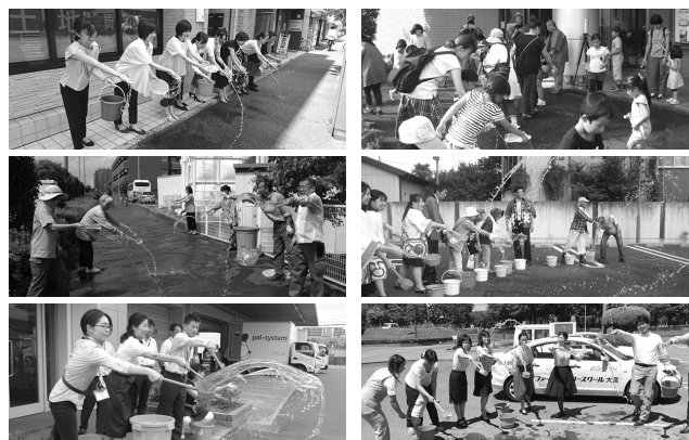
打ち水を実施いただいた団体の様子(一部抜粋)

昨年を大きく上回る31団体・個人がエントリーをし、打ち水を実施しました。メイン会場「さいたま打ち水大作戦2018」では、総勢約800人が猛暑の中打ち水を一緒に行いました。