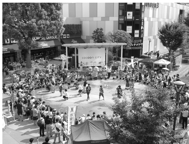
さいたま打ち水大作戦2018

夏の風物詩であり、ヒートアイランド対策にも効果があると言われる打ち水を埼玉県内で広げるため、昨年同様、地域や会社、学校などで打ち水予定の個人や団体等を募集しました。