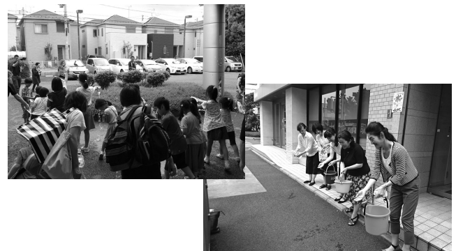
打ち水を実施いただいた団体の様子(一部抜粋)

パリクラブ21埼玉ではこの夏、日本に古くから伝わる夏の風物詩であり、ヒートアイランド対策にも繋がる打ち水を県内に広げるために「埼玉打ち水の環2017」を実施しました。地域や会社、学校などで打ち水を予定している団体や個人を募集した結果、12の団体・個人にエントリーいただきました。パリクラブ21埼玉でも7月29日(土)に行われた「さいたま打ち水大作戦2017」を埼玉打ち水の環2017のメイン会場として位置づけ、打ち水に参加しました。会員の埼玉県やさいたま市、大宮アルディージャの出演等もあり、総勢650人の参加を得ました。