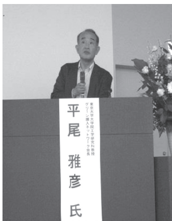
平尾会長ご講演の様子

今回は、GPN会長の平尾雅彦東京大学大学院教授に「環境に良いことを見分ける力を養う！～ライフサイクルアセスメント(LCA)とグリーン購入の基本～」と題してご講演いただきました。水道水、国産・輸入ミネラルウォーターのCO 2 排出量の違いを例にLCAをわかりやすくご説明いただきました。またエコバックは、生産工程のCO 2 排出量はレジ袋に比べて大きく、何回も使わなければエコではない、選び方と同時に使い方が重要であるとお話しされました。さらに家庭でのCO 2 削減対策などに及び、最後に、私たちの行動が将来世代に影響を及ぼすことに対して、一人ひとりが