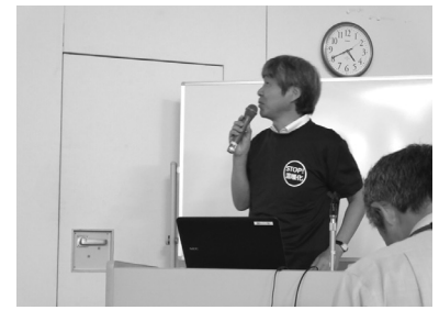
星野氏ご発表の様子

無しの今こそ、産・官・民の意識と力を結集して温暖化対策を盛り上げていくことの重要性を呼びかけました。