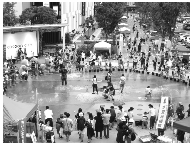
さいたま打ち水大作戦 2017

パリクラブ21埼玉ではこの夏、日本に古くから伝わる夏の風物詩であり、ヒートアイランド対策にも繋がる打ち水を県内に広げるために「埼玉打ち水の環2017」を実施しました。地域や会社、学校などで打ち水を予定している団体や個人を募集した結果、12の団体・個人にエントリーいただきました。パリクラブ21埼玉でも7月29日(土)に行われた「さいたま打ち水大作戦2017」を埼玉打ち水の環2017のメイン会場として位置づけ、打ち水に参加しました。会員の埼玉県やさいたま市、大宮アルディージャの出演等もあり、総勢650人の参加を得ました。