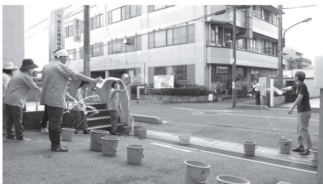
(一社) 埼玉県環境検査研究協会打ち水の様子