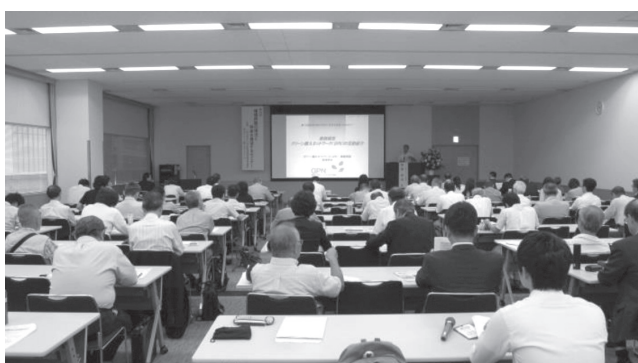
セミナー会場の様子

9月1日(金)、大宮ソニックシティ市民ホールで一般社団法人埼玉県環境検査研究協会と共催で標記のセミナーを開催しました。