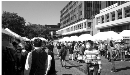
とだ環境フェア2015の様子

その他にもイベントとは異なりますが、市民や事業者による再生可能エネルギーの普及促進として、環境配