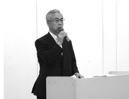
村重運営委員長による議事説明

議事では、村重運営委員長から2015年度事業報告(案)及び決算報告(案)、2016年度事業計画(案)及び予算(案)、会