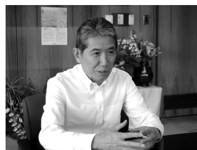
戸田市長 神保国男氏