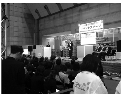
表彰式開会挨拶の様子

グリーン購入に関する優れた取り組みを表彰する「第16回グリーン購入大賞」が決定し、12月12日、東京ビッグサイトで開催されたエコプロ