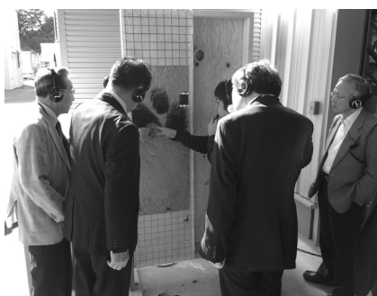
デコスファイバー防火実験の様子

式吹き込み工法を用いるため、管や配線のための穴や隙間を開けずに済み、ファイバー自体の防露・調湿性により建物の寿命を延ばすことに優れているそうです。また、難燃処理が施されているためバーナーで実際に火をかけても燃えず、万一の火災時にも延焼を防ぎ、有毒ガスの発生もなく安心とのことでした。