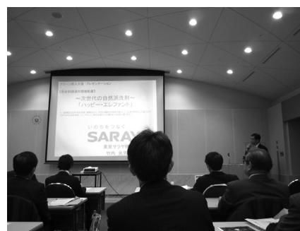
事例発表会の様子

表彰式では多くの報道関係者による取材が行われ、関心の高さが窺えました。その後の事例発表会・セミナーにも多くの